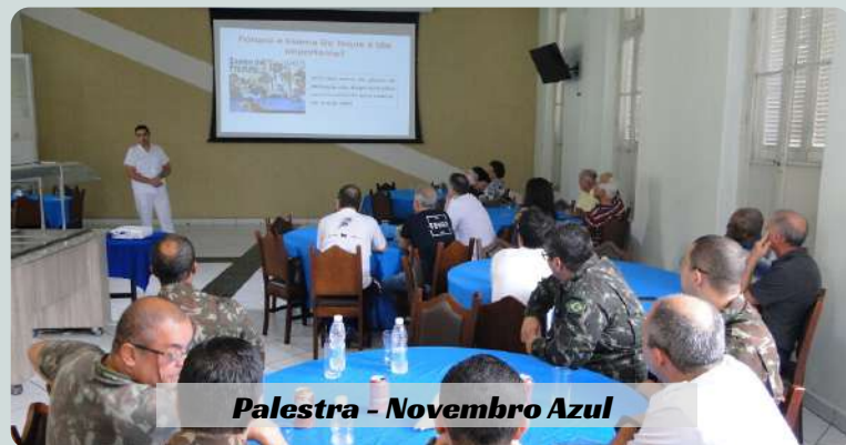
Palestra - Novembro Azul