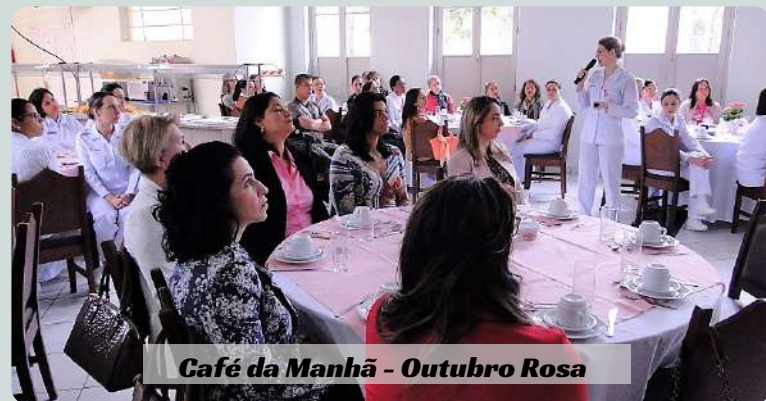
Café da Manhã - Outubro Rosa

O Hospital Geral de Curitiba (HGeC) ofereceu no dia 11 de outubro um café da manhã dedicado ao estímulo da participação do público-alvo na prevenção ao Câncer de Mama. Participaram do evento militares, dependentes e funcionárias civis do HGeC, pacientes e convidadas que foram contempladas com camisetas alusivas à campanha.